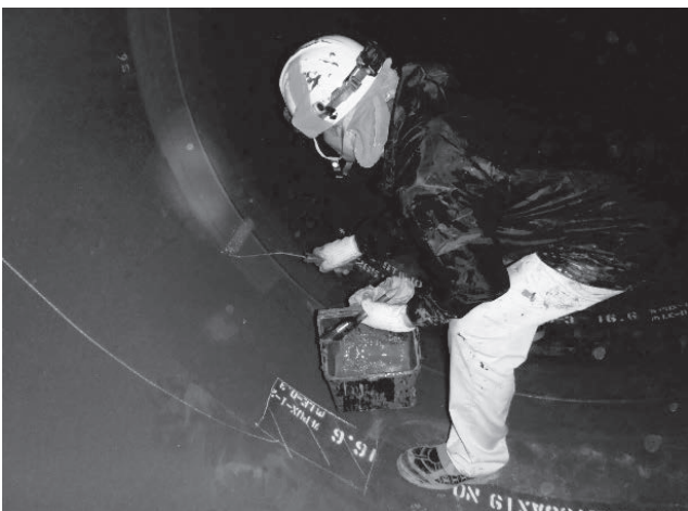
写真3 塗覆装鋼管内面塗装状況