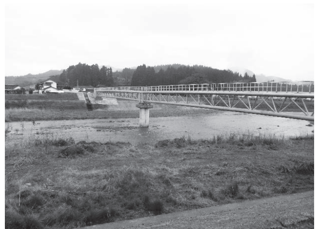
写真5 ステンレス水管橋