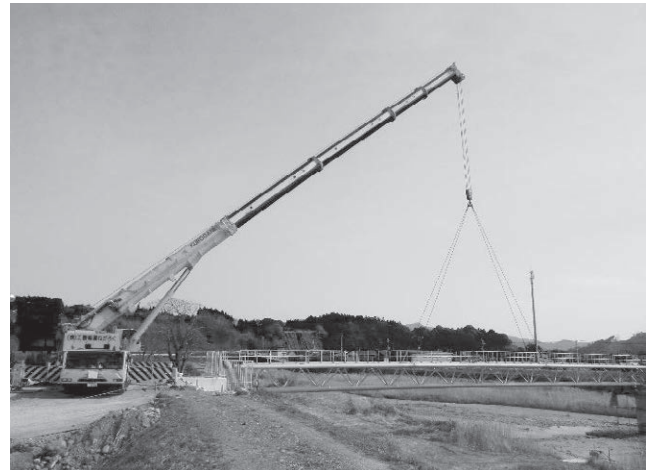
写真4 ステンレス水管橋架設状況