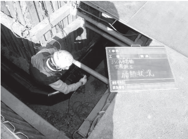
写真2 塗覆装鋼管ジョイントコート